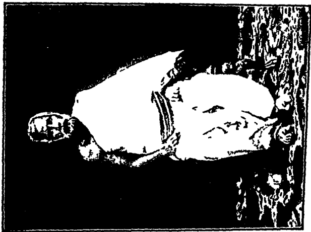
स्वप्ति श्री१०८ वीरसिन खात्री महारक सथान-कारजा ।